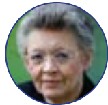
Pr Françoise Barré-Sinoussi Prix Nobel de médecine et de physiologie 2008

Françoise Barré-Sinoussi est membre de l'Académie des Sciences, directrice de recherche émérite à l'Inserm, et a dirigé l'unité « Régulation des Infections rétrovirales » à l'Institut Pasteur jusqu'en 2015. Impliquée dans la recherche en rétrovirologie depuis le début des années 1970, elle est reconnue pour ses contributions dans le domaine du VIH-sida, notamment en tant que première auteure de la publication qui annonce en 1983 la découverte du virus responsable du sida, nommé plus tard VIH, découverte qui lui vaudra le prix Nobel de médecine en 2008. Auteure et co-auteure de plus de 300 publications, Françoise Barré-Sinoussi a été et est encore membre de nombreux comités de haut niveau en France et à l'étranger. Officiellement à la retraite, Françoise Barré-Sinoussi n'en reste pas moins active sur la scène internationale. Elle est notamment présidente du conseil d'administration de Sidaction, présidente d'honneur du Réseau international et du département de Virologie de l'Institut Pasteur et membre du think tank « Santé Mondiale 2030 ».